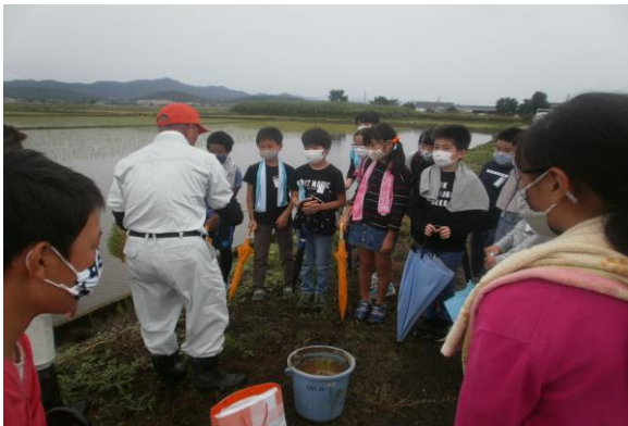
佐取農機社長様に御指導いただきました。