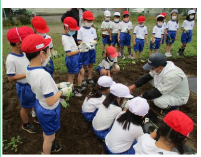
1・2年生の協働です。