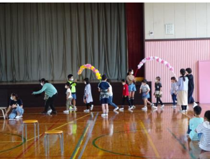
心をこめた学年紹介等でした。