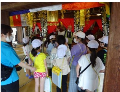
龍江院に訪問しました。