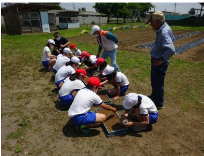
もみまきをしました。