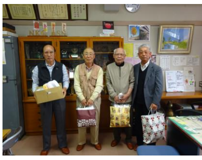
多くの雑巾をいただきました。