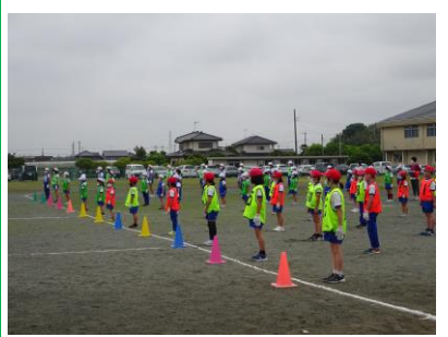
全部で4回行います。