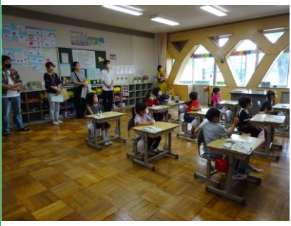
1年生、初の授業参観です。