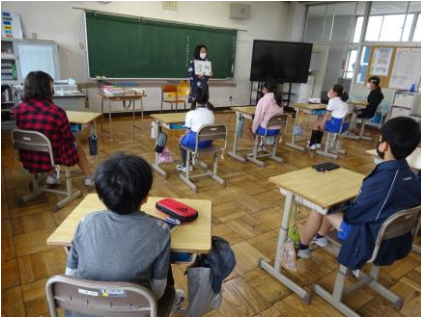
2年生、6年生で行いました。