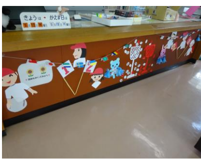
運動会に向けた装飾です。