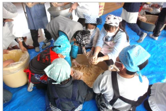
5年・家庭科の「味噌汁作り」が楽しみです！