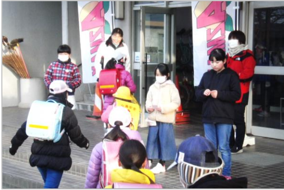
みんなであいさつマスターをめざそう！