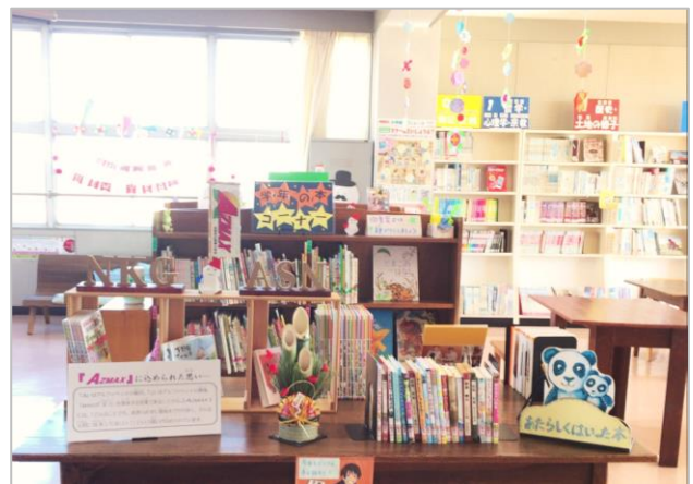
新春用に飾られた学校図書館

今年度も『N・K・G』を中心に吾妻小をさらに発展させていきたいと思っておりますので、引き続き御支援をよろしく申し上げます。