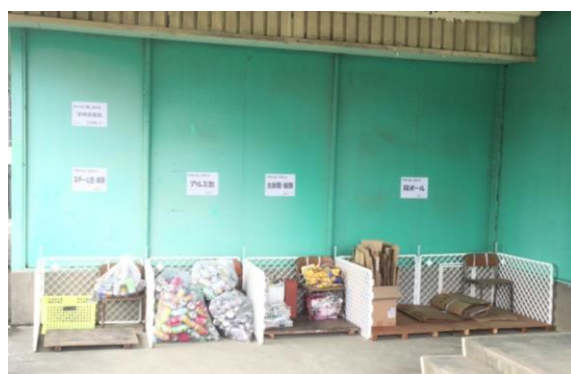
体育館南側に設置された『リサイクル・スタンド』すでに、多くの資源が搬入されています。

また、PTA総会后に校長よりお話しさせていただいた『N・K・G』（日本一きれいな学校にしよう！）についても、皆様に御理解をいただき、早速、図書館改造に向けた「毎日が廃品回収！」への御協力を頂いております。誠にありがとうございます。今年度は、例年実施している廃品回収（6月・12月）に加え、体育館の南側に『リサイクル・スタンド』を設置しましたので、是非、御協力をお願いします。