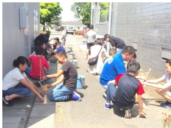
火起こしを体験しているところ 「なかなか火がつかないな〜。」

6年生が社会科の校外学習として、佐野市郷土博物館に出かけました。『体験』では、「どんぐりのすりつぶし」と「火起こし」を体験しました。火起こしは初めてだったので、なかなか火が付かず苦労していました。『見学』では、「縄文時代から天平時代までの佐野市の歴史」を中心に見学しました。『講座』では、遺跡や古墳の話クイズ形式で楽しく聞きました。そして最後に、本物の土器の破片を触らせていただきました。歴史の楽しさを実感できる貴重な時間を過ごすことができました。