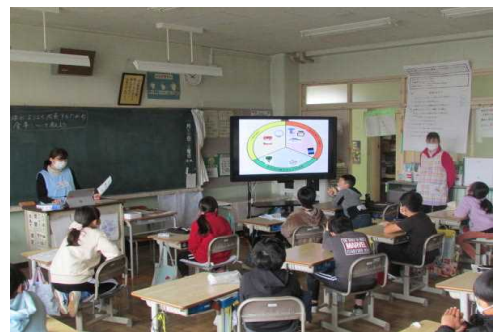
4年生 食に関する指導の様子

旗川小学校では、1月16日（月）から20日（金）を「校内給食週間」と位置付け、日頃いただいている給食に携わる方々への感謝の気持ちをもつ活動として、お礼の手紙を書いたり、昼の放送で、給食・保健委員会の児童から、給食が始まった歴史や栄養について学んだりしました。