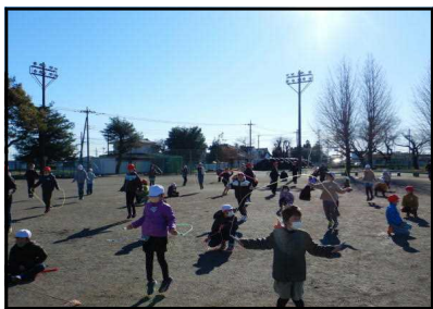
〈全校なわとびをするくすのきっ子〉