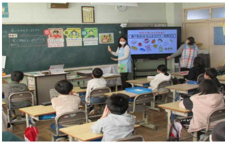
3年生 食に関する指導の様子

また、「食に関する指導」の一環として、北部給食センターの栄養教諭の先生を授業の講師にお招きして、日常の食事や給食に関心を持ち、バランスのとれた食事の大切さや食物の栄養素について、発達段階に応じて、分かりやすく教えていただきました。講師の先生からは、意欲的に学ぶ姿に「旗川小の児童は立派な態度で感心しました」とお褒めの言葉をいただきました。