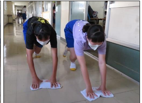
3年1組前の廊下掃除