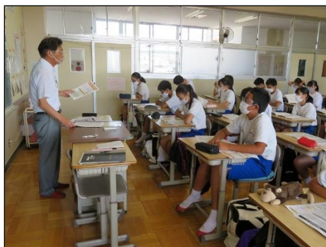
金融広報委員会アドバイザーによる金銭教育