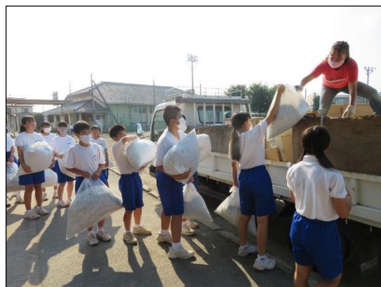
トラックにシュレッダーゴミを積み込む生徒

8/21(金)の朝、今年度第2回目の「アルミ缶・古新聞・古雑誌回収」を行いました。エコリサイクル委員や積み込み当番となった部の生徒が朝早くから登校し、手際よく活動していました。アルミ缶や古新聞などをたくさん持ってきてくださった地域の方々もいました。今回の収益金は、市からの報奨金と合わせて9,710円、5/22に職員作業として行った第1回目は18,020円でした。これら収益金は生徒活動支援金として、三轟・唐沢縦走のゼリー代など、主に学校行事で使用させていただいております。次回第3回目は11/13(金)、第4回目は年明け2/5(金)の予定です。これらの回収日以外でも、保護者の皆さんが学校にいらした際にいつでも預かりますので、御協力くださいますようよろしくお願いいたします。