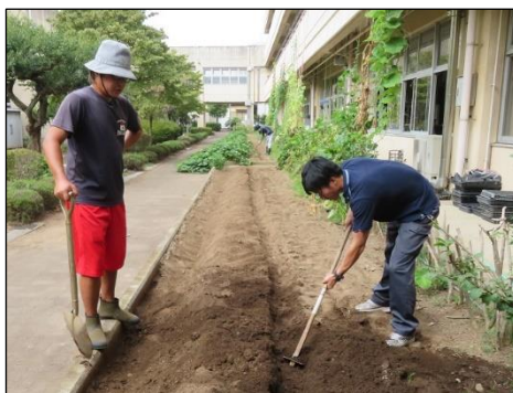
4Hクラブの方々による農業指導

今年度は、感染症対策として保護者の方々を含め、外部の方々の学校への出入りを制限せざるを得ない状況ですが、地域の教育力を生かし学習効果を上げるために、徐々に外部講師による授業を取り入れるようにしています。