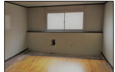
洋式トイレが設置される現在の体育館の用具室