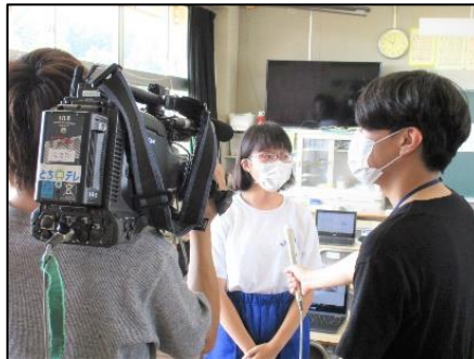
インタビューに答える1年生(とちぎテレビの取材)