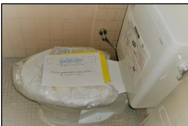
校舎内トイレの半数が洋式化されました

保護者の皆様には、学校にお越しいただく際、何かと御不便をおかけしますが、御理解・御協力くださいますようお願いいたします。