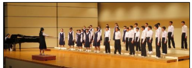
昨年度の北星祭の様子