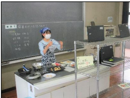
簡単なおやつの方を説明する家庭科のオンライン学習の様子

8/30(月)・31(火)の男女別分散登校日に、タブレットパソコンを使つてのオンライン学習の説明を行い、9/1(水)から9/10(金)までオンラインビデオ会議サービス Google Meet を活用して、各教科の学習を行いました。また、課題や資料の一括配付、進行チェックなどができる Google Classroom を活用して、朝の健康観察や終会時の諸連絡を行いました。生徒たちは夏休み中からタブレットを使用していることもあり、パソコンの操作スキルが格段に向上したことと思ひます。職員にとつても、今回の臨時休業中の対応を通して、オンライン学習の在り方について見識を深めることができました。