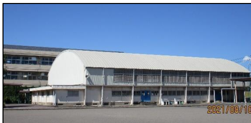
屋根の補修と照明のLED化工事が行われる体育館