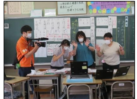
Webカメラに向かって手を振る国語科教員(佐野ケーブルテレビの取材)