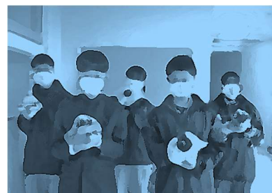
色づかいに個々のセンスを感じます。