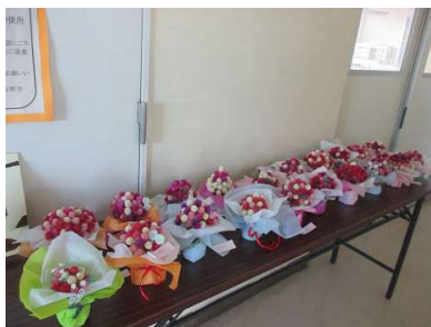
素敵なアレンジができました！

あっという間に2月。如月は、寒くて「衣更着」とも、木が芽吹いて春に向かう様子を表すともいわれています。