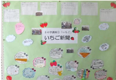
さの学①いちごー「いちご新聞」

令和5年度 7月号 R5. 6. 28 発行：佐野市不登校児童生徒支援教室 「アクティヴ教室」