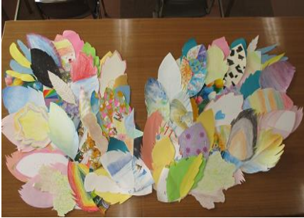
「希望の翼」の作成中です

令和5年度 2月号 R6.1.26 発行：佐野市不登校児童生徒支援教室 「アクティヴ教室」