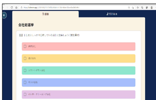
【作成したアンケート】