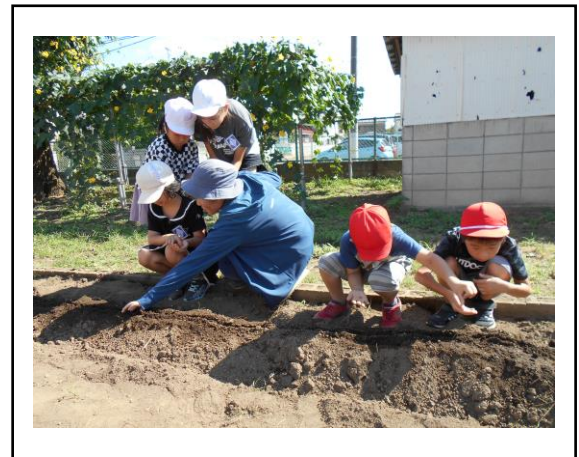
<実際に種を蒔いています>