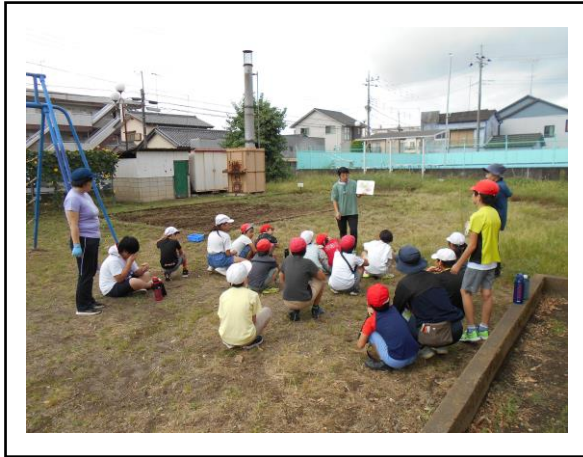
<野菜の育ち方の説明を聞いています>

たんぽぽ・ひまわり学級では、毎年農園活動をしています。小さな種からたくさんの大きな野菜を育てる体験は、子供たちの興味関心が高く、みんな楽しく取り組んでいます。また農園活動は野菜の育ちを学べるだけでなく、食育や気持ちの安定、自己肯定感を高めるなどの効果もあります。ぜひご家庭でも子供たちと一緒に野菜を育ててみてください。