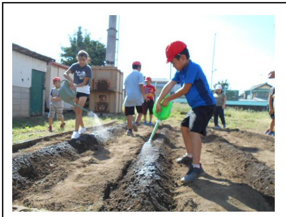
<心を込めて水をやっています>