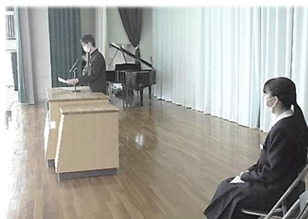
「新年度の抱負」発表の様子

令和3年度が始まりました。4/8(木)の始業式、始業式では各学年を代表して、2年〇〇さん、3年〇〇さんから、「新年度の抱負」の発表がありました。それぞれ、学習や学校生活、部活動、そして進路実現など、具体的な発表がありました。