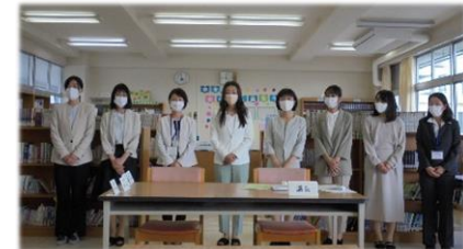
PTA新本部役員の皆様 (図書室からオンライン)