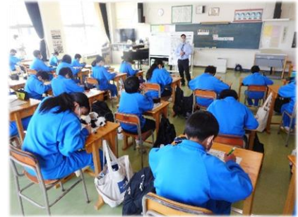
授業参観(学級活動)の様子

近年、教員の長時間労働が問題となるなど、「学校における働き方改革」は喫緊の課題となっております。また、競技経験のない教員が部活動の顧問となり、専門的な指導ができない場合があるなどの課題もあります。