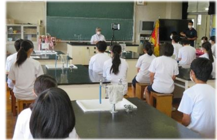
※全校集会は理科室からオンラインで実施

夏休み明け初日の8月30日(火)の全校集会では、校長講話として、ここから1学期終業式と2学期始業式を挟み、年末まではとても大切な時期であることを話しました。特に3年生にとっては、9年間の義務教育を終えてこの先の進路を決定する大切な期間で、希望する進路が実現できるかは、この期間の過ごし方にかかっていることを話しました。また、1・2年生には中心となって活動する部活動はもとより、学習や学校での様々な活動により一層積極的に取り組んでほしいと話しました。