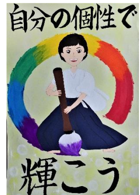
人権啓発ポスター優秀賞作品