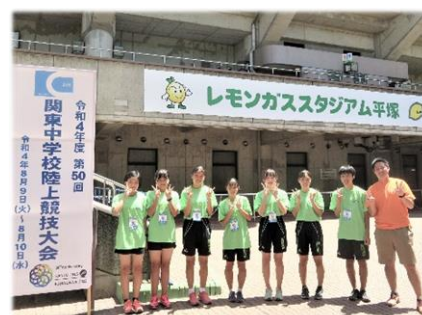
※関東大会に参加した生徒の皆さん